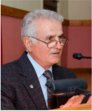
Χρήστος Γιανταμίδης Πλοίαρχος (ε)ε.α. Πολεμικού Ναυτικού

Την 19η Μαΐου του 2022, συμπληρώνονται 103 χρόνια από την απόβαση του Μουσταφά Κεμάλ και του επιτελείου του στην Σαμφούντα με το πλοίο BADIRMA, με την άδεια των Άγγλων, αλλά και της τότε Οθωμανικής κυβέρνησης, με το πρόσχημα της εξολόθρευσης των ληστοςυμμοριών, φανατικών Μουσουλμάνων, που δρούσαν και δημιουργούσαν προβλήματα στους Χριστιανούς, για να επιβάλλει δήθεν την τάξη και την νομιμότητα. Αντ' αυτού, συγκεντρώνει τις μάζες των Μουσουλμάνων και φανατίζοντάς τους, άρχισε το δεύτερο σχέδιο της γενοκτονίας των Ελλήνων του Πόντου. Συνεργάζεται με τις συμμορίες αυτές, καθορίζοντας ως επικεφαλή του δολοφονικού τάγματος τον αδίστακτο και αιμοδιψή Τοπάλ Οσμάν, με σκοπό να ολοκληρώσει την γενοκτονία των Ελλήνων της Μικράς Ασίας, του Πόντου και της Ανατολικής Θράκης, η οποία είχε αρχίσει μεθοδικά και συστηματικά από το 1914, από τους Νεότουρκους.